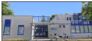
Huisartsenpraktijk Medi-Mere Locatie Almere Buiten Haasweg 9 1338 AW Almere Buiten