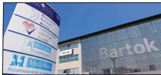
Huisartsenpraktijk Medi-Mere Locatie Almere Stad (Bartok Kliniek) Bartokweg 161 1311 ZX Almere Stad